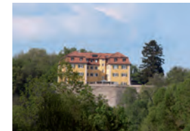
Ausgangspunkt der Spur: Grafeneck