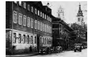
Ziel der Spur: Innenministerium Stuttgart.